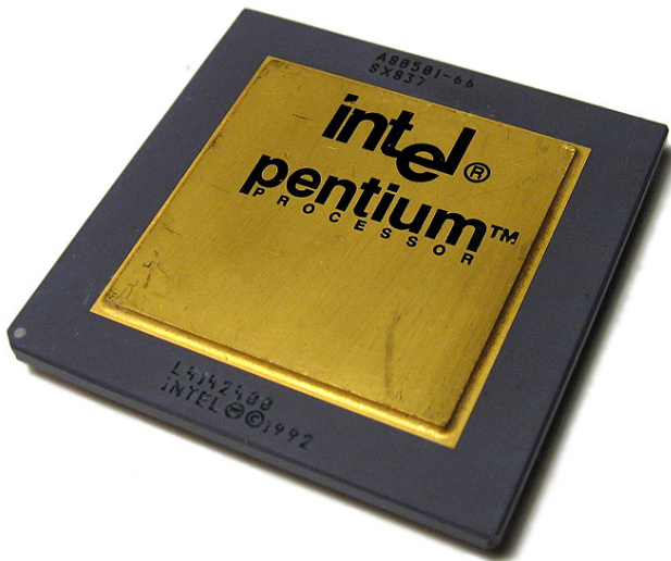
Intel Pentium Prozessor 1993.