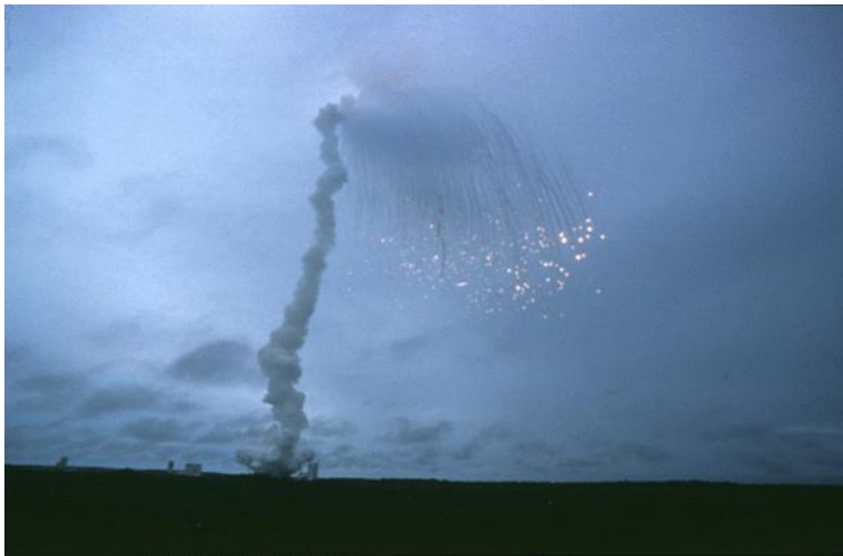
Explosion der Ariane 5 am 4. Juni 1996.